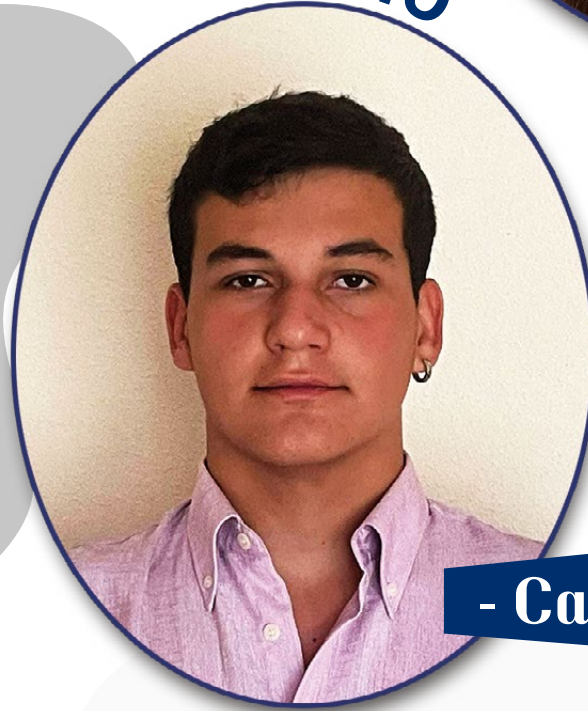
- Caballero -